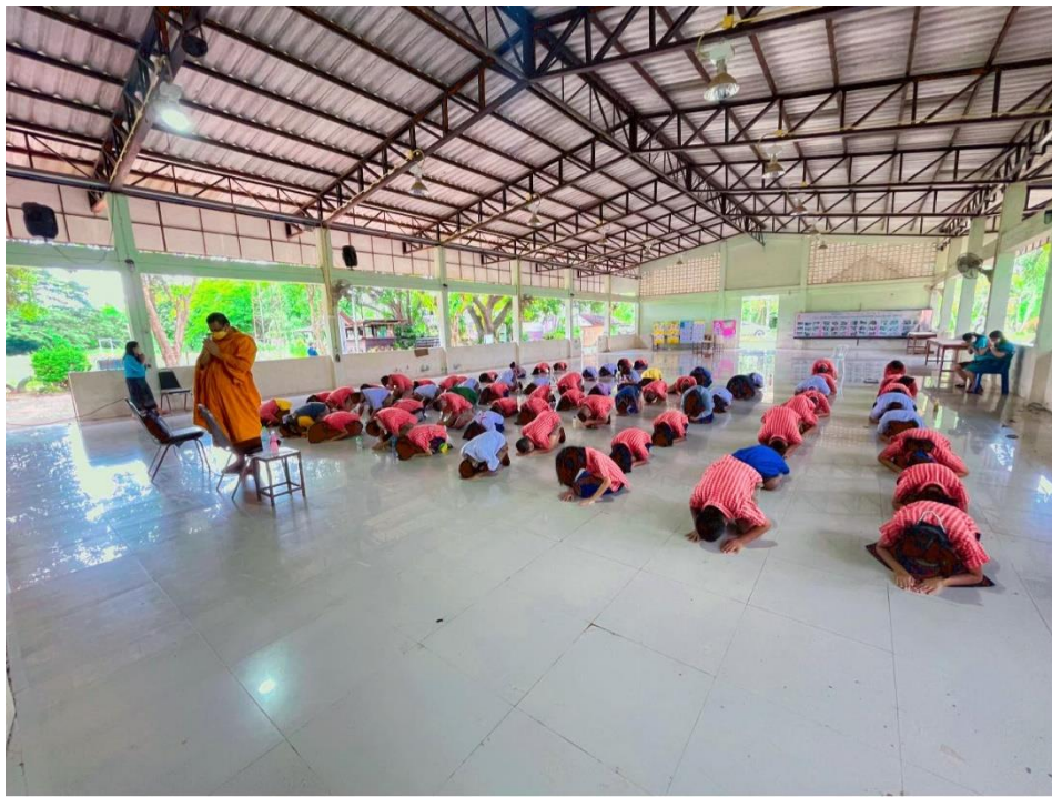
โครงการส่งเสริมคุณธรรม

กิจกรรมที่ ๓ จัดโครงการค่ายคุณธรรมฯ สำหรับนักเรียน ,โครงการ ครู DARE ,โครงการส่งเสริมคุณธรรมจริยธรรมนักเรียน เพื่อปลูกฝังจิตใจ ให้เป็นผู้มีคุณธรรม และไม่กระทำการทุจริตในอนาคต